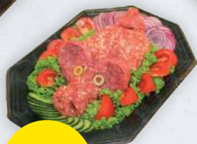
Mett-Schwein- Platte 1 kg