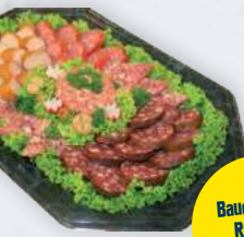
Bauernplatte Rustikal für 5 Pers.