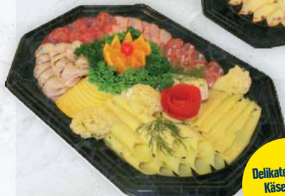
Delikate Wurst- Käseplatte für 10 Pers.