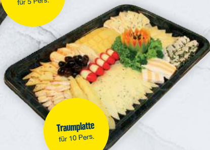
Traumplatte für 10 Pers.