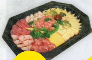
Kleine gemischte Platte für 5 Pers.