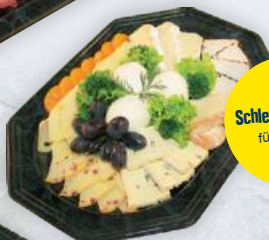
Schlemmerplatte für 5 Pers.