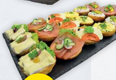
Belegte Brötchen versch. Sorten