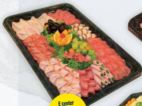
E center Warnow Park Spezialplatte für 10 Pers.