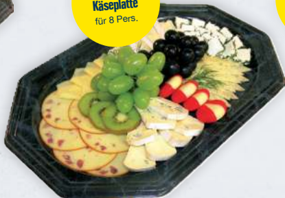
Delikate Käseplatte für 8 Pers.