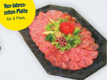
Vier-Jahres- zeiten-Platte für 5 Pers.