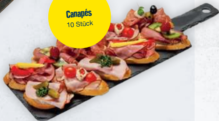
Canapés 10 Stück