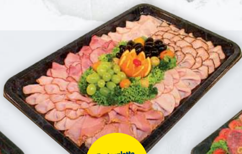
Bratenplatte Spezial für 10 Pers.