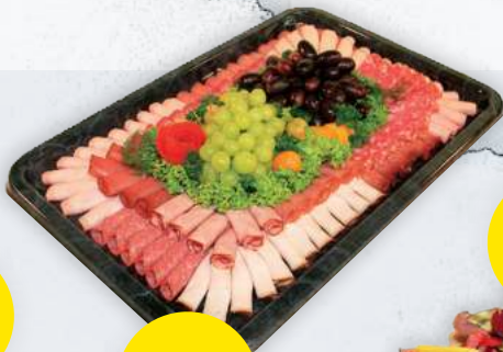
Familienplatte für 10 Pers.